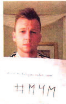
Cheryshev (22), futbolista.