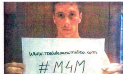
Fernando Torres (29), con el lema de la campaña.